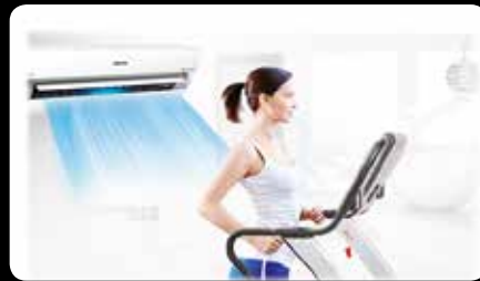
1. lépés: Fast Cool

Gyors hűtés és hőmérséklet tartás. A Fast Cool funkció segítségével gyorsan lehűtheti a levegőt majd a berendezés automatikusan WindFree üzemmódba vált, ezzel megőrizve a beállított hőmérsékletet.