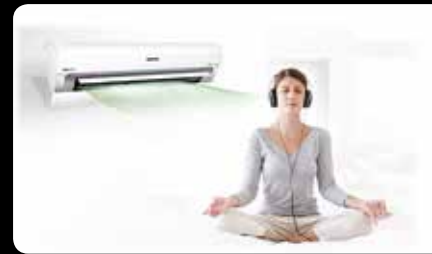
2. lépés: Comfort Cool