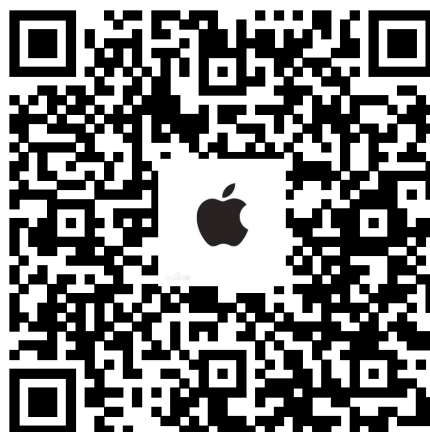
Apple iOS rendszer