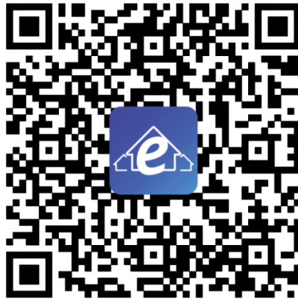
Konfigurációs QR kód